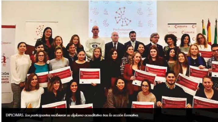
DIPLOMAS. Los participantes recibieron su diploma acreditativo tras la acción formativa.

Treinta y nueve personas aprenden la gestión de su propio negocio y equipo