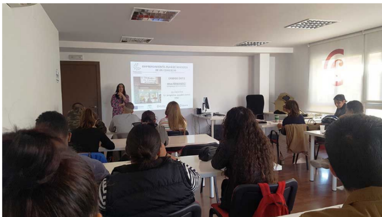
Programa PROCOM de la Cámara de Comercio de Málaga.

Esta iniciativa, que comenzó el pasado 21 de octubre, ha constado de un programa formativo de 90 horas de duración, en el que han participado veintiuna personas (14 mujeres y 7 hombres), impartándose sesiones teóricas y prácticas sobre los conocimientos y habilidades necesarias en las distintas áreas relacionadas con un establecimiento comercial, además de contar con tutorías individualizadas que han permitido el desarrollo de un total de 17 planes de negocio, con asesoramiento especializado y adaptado a cada uno de los alumnos.